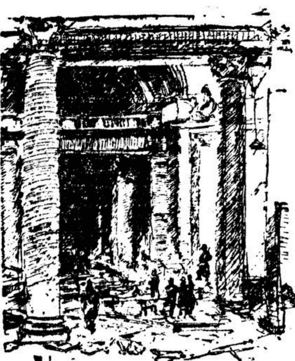
У входа в здание рейхстага (Берлин) Рисунок В. НЕЧАЕВА