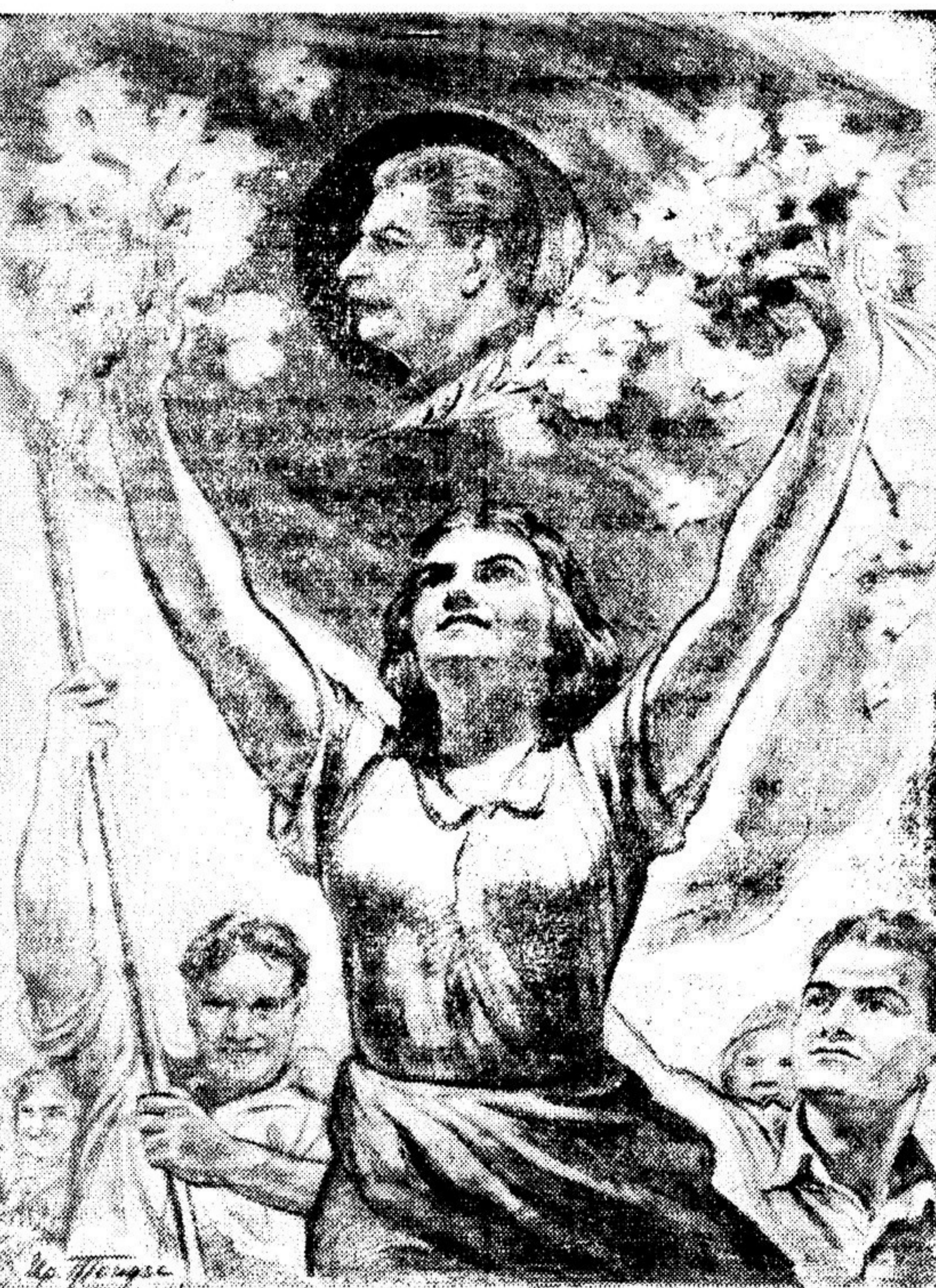
Рисунок И. ТОЙДЗЕ

Иллюстрации для книги готовит художественная студия им. Грекова. Объем книги — около 40 авторских листов.