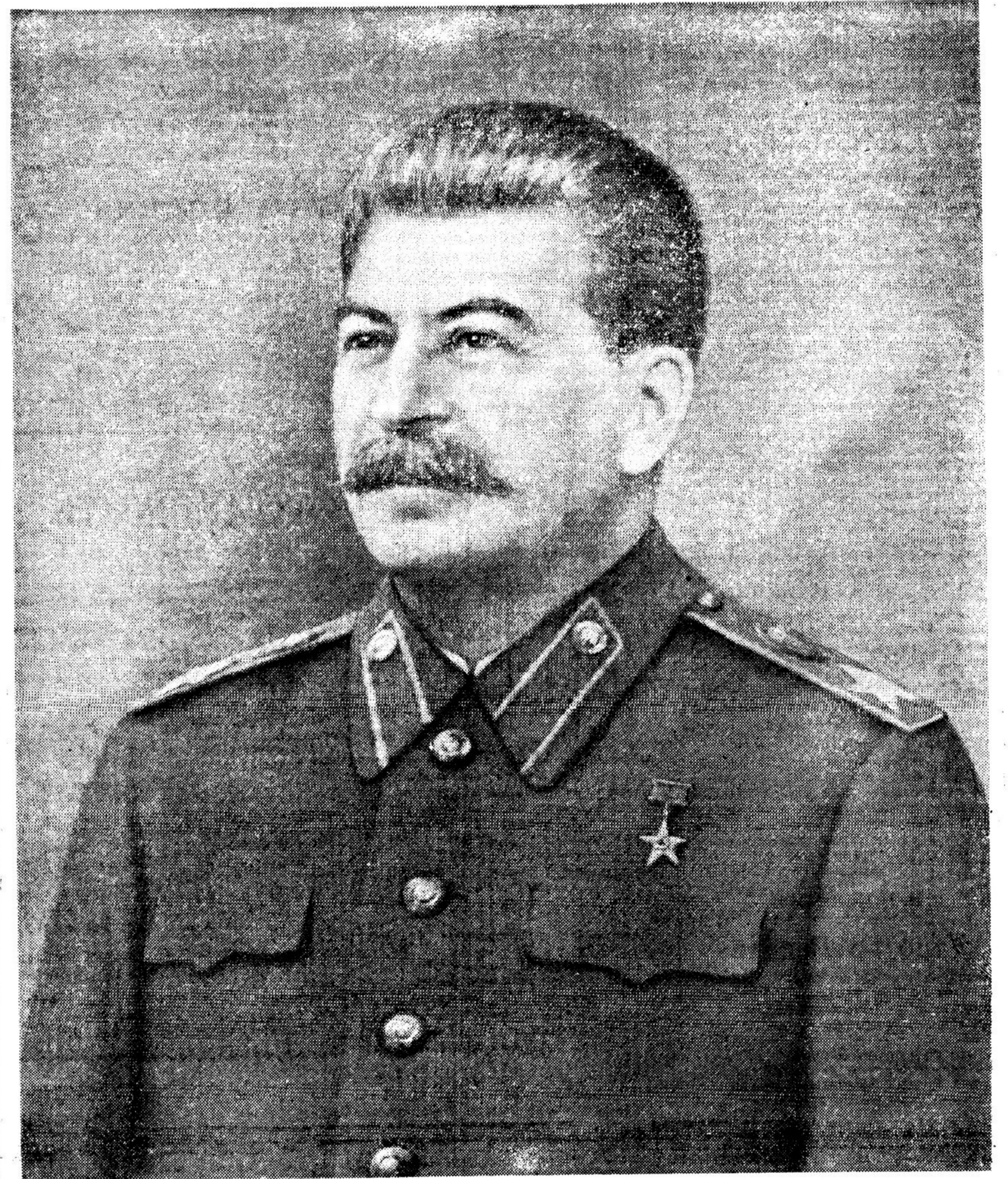
Министр Вооруженных Сил Союза ССР Генералиссимус Советского Союза И. СТАЛИН.

Под знаменем Ленина, под водительством Сталина — вперед к новому расцвету Советской Родины, к полной победе коммунизма в нашей стране!